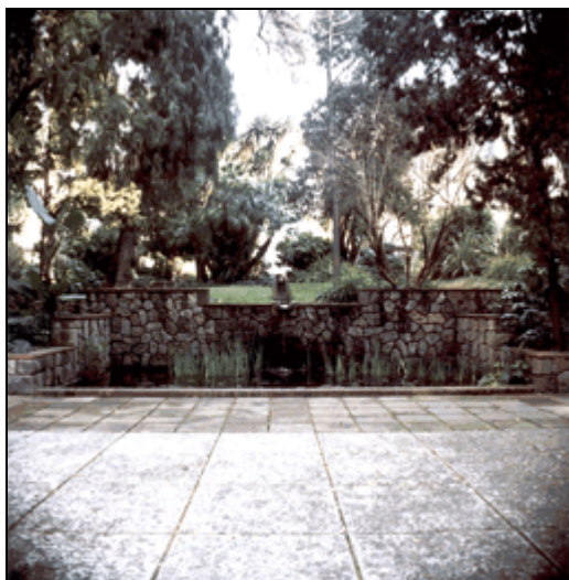
Jardí Ferran Soldevila a la Universitat de Barcelona (Edifici Central).

Per presentar el producte al client s'ha de fer amb les millors condicions de recepció, han de ser òptimes. Cal presentar la producció de la millor manera possible: una bona imatge i un bon so. És a dir, s'haurà de trobar una sala o un espai que pugui garantir una sonoritat bona i un bon visionat. Per exemple, en aquest cas, el lloc escollit és l'espai que hi ha entre el vestíbul principal de la Universitat de Barcelona i el jardí de Ferran Soldevila.