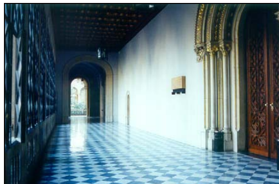
Galeria del Paraninf de la UB (Edifici Central).